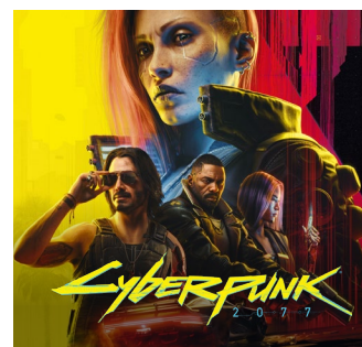
2020 – PC, Xbox One, PS4, Stadia 2022 – Xbox Series X|S, PS5