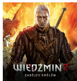
2011 – PC 2012 – X360