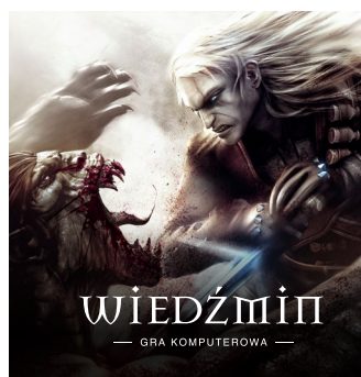
2007 – PC