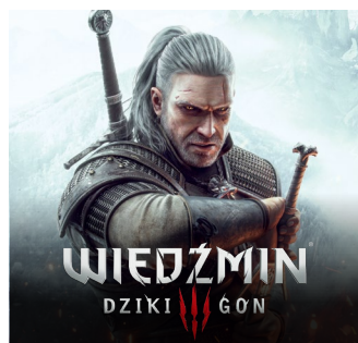
2015 – PC, Xbox One, PS4 2019 – Nintendo Switch 2022 – Xbox Series X|S, PS5